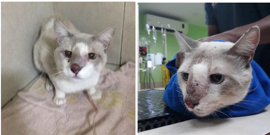
Figura 1 y 2. Felino con lesiones faciales.

Citología: Se toma por Punción de Aguja Fina (PAF) la muestra. Se tiñe con Diff Quick y lugol, observándose microscópicamente estructuras leveduriformes, ovales a redondeadas, presentando cápsula a su alrededor con presencia de infiltrado neutrofílico y discreto infiltrado histiocítico características del Cryptococcus (Fig. 5 y 6).