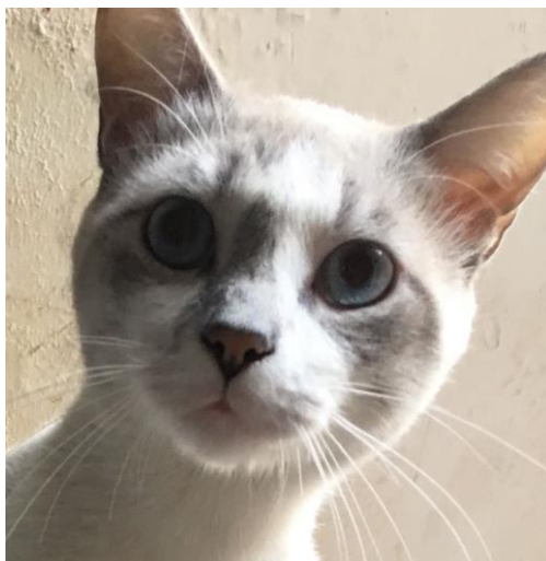
Figura 7. Fotografía del estado actual del paciente post tratamiento (3 meses)